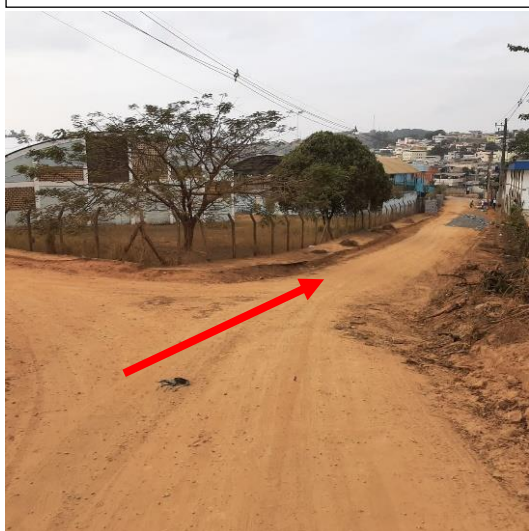
Rua. Rita Vieira Lima