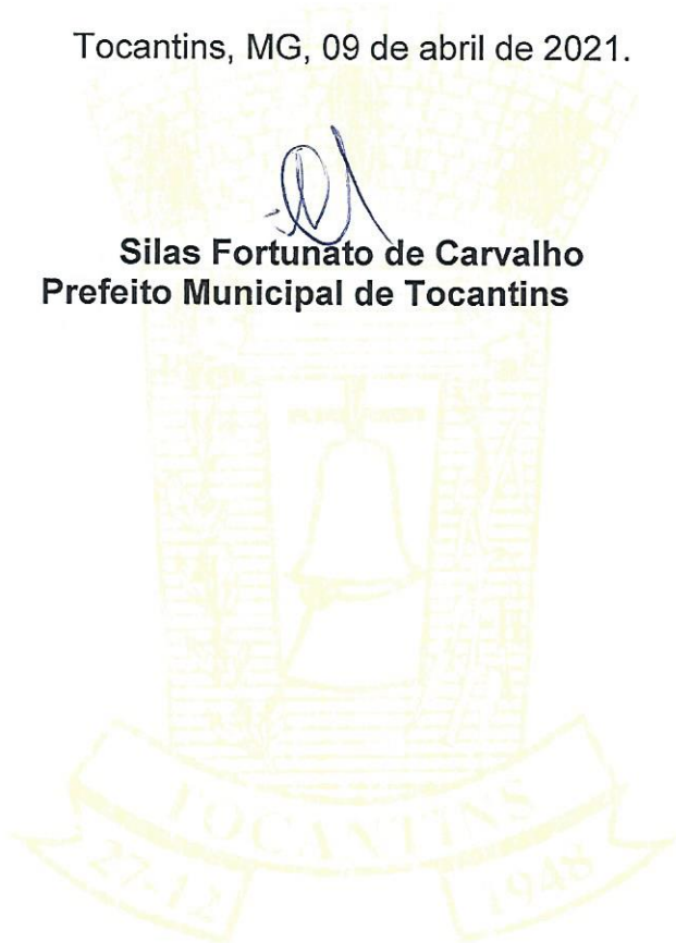
Silas Fortunato de Carvalho Prefeito Municipal de Tocantins